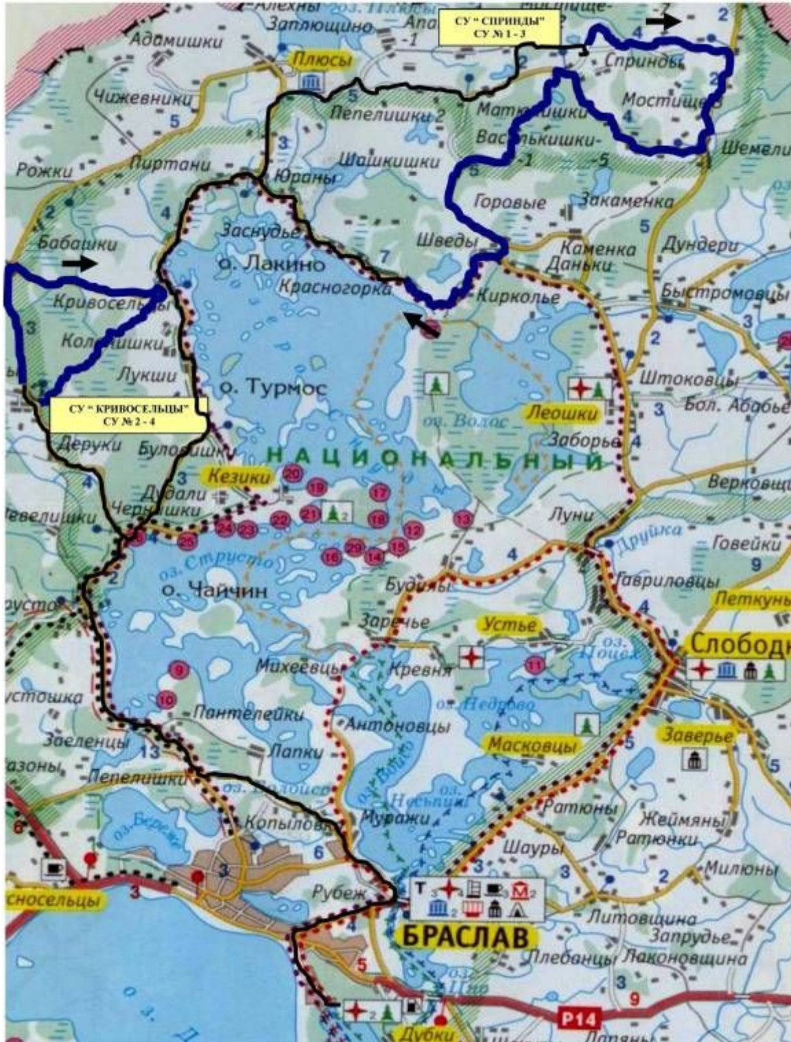
СХЕМА ДВИЖЕНИЯ СПОРТИВНЫХ АВТОМОБИЛЕЙ НА ПЕРВОЙ СЕКЦИИ (20.12.2008г.)