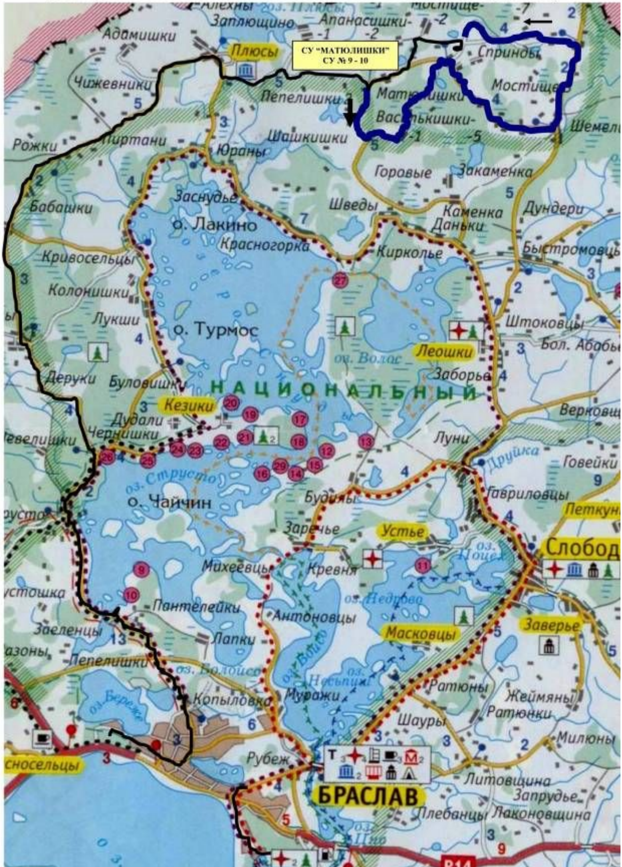
СХЕМА ДВИЖЕНИЯ СПОРТИВНЫХ АВТОМОБИЛЕЙ НА ТРЕТЕЙ СЕКЦИИ (21.12.2008г.)