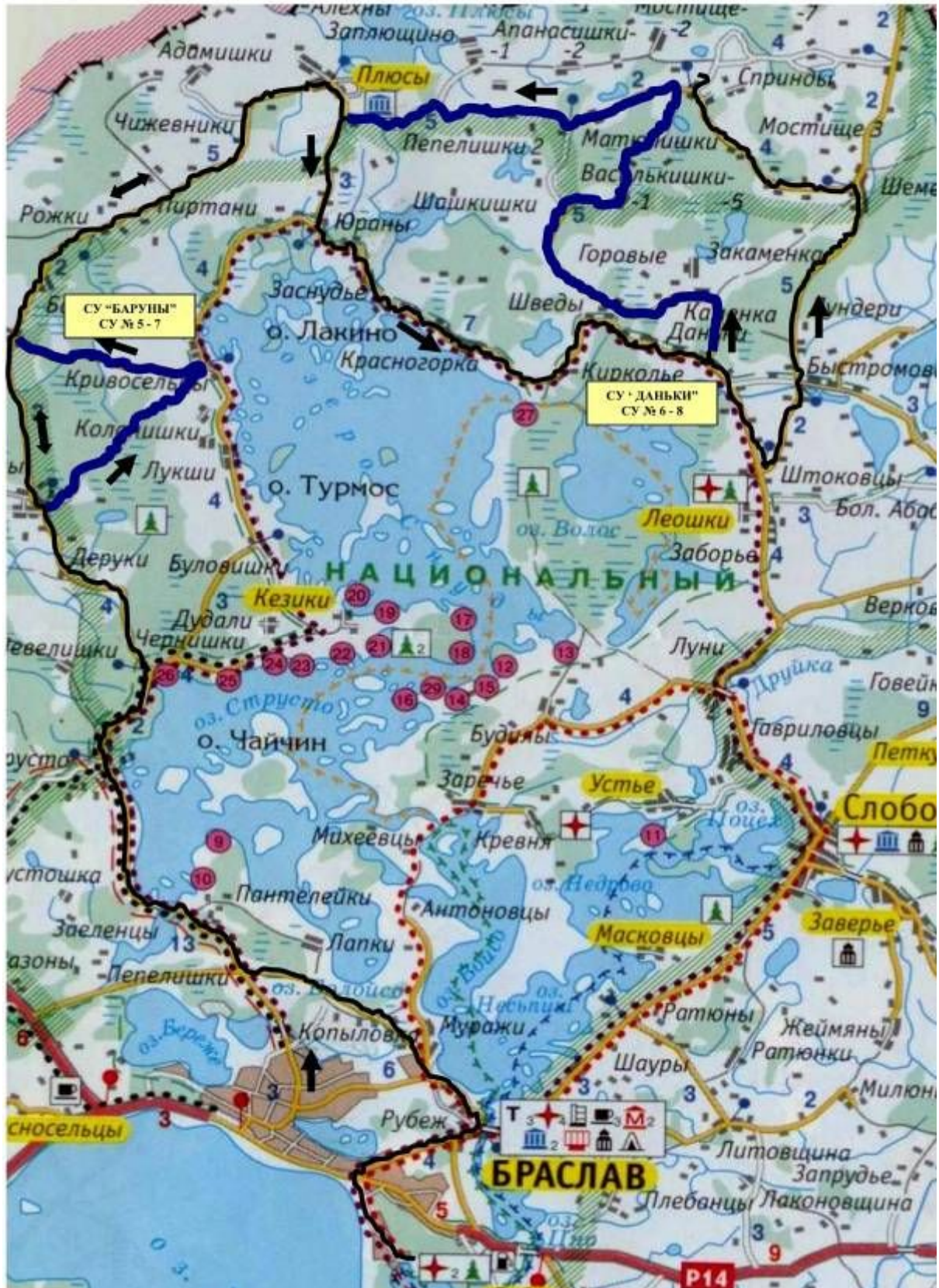
СХЕМА ДВИЖЕНИЯ СПОРТИВНЫХ АВТОМОБИЛЕЙ НА ВТОРОЙ СЕКЦИИ (21.12.2008г.)